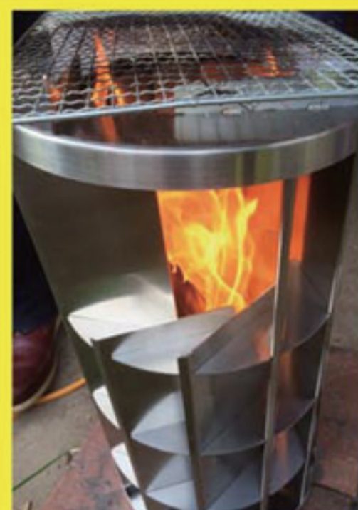
■ 火炎の横漏れなし