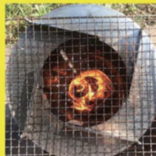
■ 火炎が炉内部で旋回する