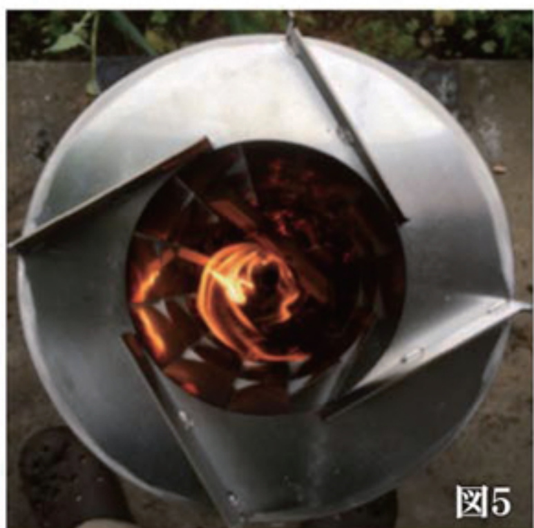
※五徳の開口から集中して熱がでる。