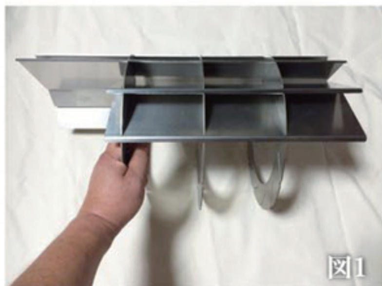
※ドーナツ板3枚、羽板長10枚、羽板短2枚、受け皿1枚、五徳1枚、パンチ板1枚、支え棒1本